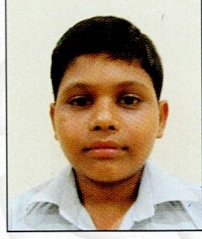
ખેર મચુર માદેવા માંડણ રાપર ૯૦.૮૩% (૧૬૩૫/૧૮૦૦)