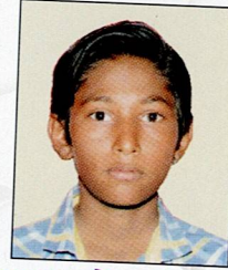
મિણાત ભાવેશ કરશન રાઘુ પદમપર ૭૨.૫૦% (૪૩૫/૬૦૦)