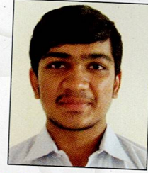
સાંઢા ઘનશ્યામ ધનજી શામા આધોઈ ૭૭.૦૦% (૫૩૯/૭૦૦)