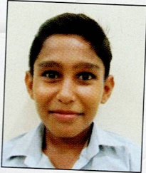
વૈદ હાર્દિક નારણ કેશા હમીરપર ૮૪.૮૬% (૫૯૪/૭૦૦)