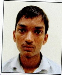
ગાંધી અકેશ માંડણ ભગા દેશલપર ૭૯.૧૭% (૪૭૫/૬૦૦)