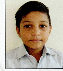
દુબરીયા નાગજી કેશા હરખા સઈ ૭૧.૩૩% (૧૨૮૪/૧૮૦૦)