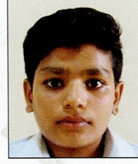
રાવરીયા મહેક કરમણ રાઘુ પદમપર ૮૨.૭૮% (૧૪૯૦/૧૮૦૦)