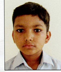
સાંઢા કિષ્ના હિરા રણછોડ સઈ ૭૩.૧૭% (૧૩૧૭/૧૮૦૦)