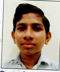
ભ્રાસડિયા પ્રવિણ ધરમશી વેલા મોડા ૭૮.૪૩% (૫૪૯/૭૦૦)