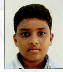
ભાંડવા યશ ગોવિંદ કાનજી મોડા ૮૨.૪૪% (૧૪૮૪/૧૮૦૦)