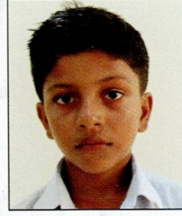
બાંભણીયા ઋત્વિક વીરા તેજા નીલપર ૯૦.૦૬% (૧૬૨૧/૧૮૦૦)