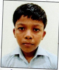
બાંભણીયા મુકેશ વિરા તેજા નીલપર ૮૦.૮૩% (૪૮૫/૬૦૦)