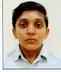
સાંઢા રાજ ધનજી શામજી રાપર ૮૭.૧૭% (૧૫૬૯/૧૮૦૦)