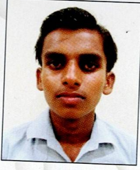
મેરા જયસુખ લાલજી ઉકા ગોવિંદપર ૮૧.૨૯% (૫૬૯/૭૦૦)