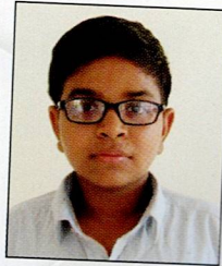
નોર પ્રતિક હરખચંદ જેશા સરદાર નગર ૭૩.૦૦% (૫૧૧/૭૦૦)