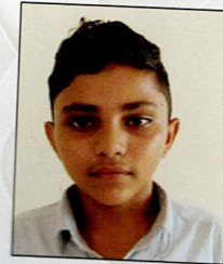
ભુષણ વિનોદ ભવાન મોમાયા ખાંડેક ૭૧.૫૭% (૫૦૧/૭૦૦)