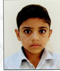
સાંઢા હરેશ નારણ હરજી સઈ ૭૪.૫૦% (૧૩૪૧/૧૮૦૦)