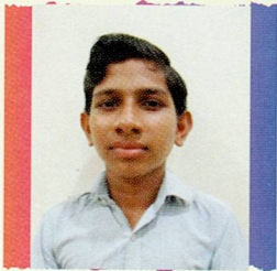
ભ્રાસડીયા પ્રવિણ ધરમશી વેલા ગોવિંદપર ૭૨.૬૭% (૪૩૬/૬૦૦)