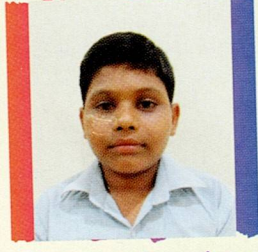
જેર મથુર માદેવા માંડલા રાપર ૯૪.૬૭% (૧૭૦૪/૧૮૦૦)