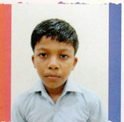
બાંભણીયા મુકેશ વિરા તેજા નીલપર ૮૮.૫૭% (૬૨૦/૭૦૦)