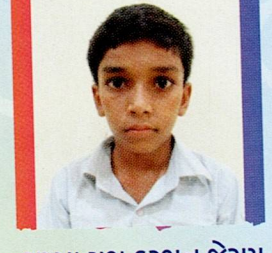
ભપ્પા યશ કરશન જેરામ કાનપર ૯૪.૫૬% (૧૭૦૨/૧૮૦૦)