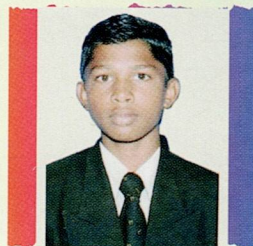
ઢાઢી રાજ કરસન ગોવા આઘોઈ ૭૦.૬૭% (૪૨૪/૬૦૦)