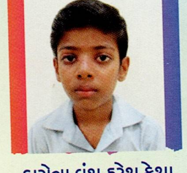
કારોત્રા વંશ હરેશ કેશા રાપર ૮૮.૩૯% (૧૫૯૧/૧૮૦૦)