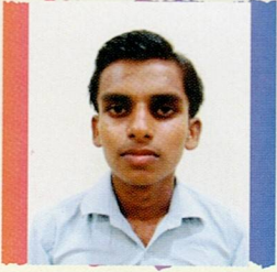
મેરા જયસુખ લાલજી ઉકા ગોવિંદપર ૭૪.૭૧% (૫૨૩/૭૦૦)