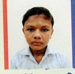
દુબરીયા દિનેશ શામજી હિરજી સઘ ૯૭.૭૮% (૧૭૬૦/૧૮૦૦)