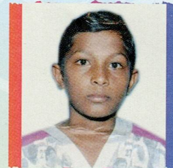
ભ્રાસડીયા દિનેશ ધરમશી વેલા મોડા ૭૬.૧૪% (૫૩૩/૭૦૦)