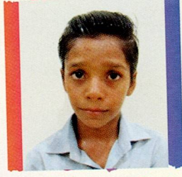
વેરાત વિનોદ કરમશી ગાંગા સઘ ૯૦.૪૪% (૧૬૨૮/૧૮૦૦)