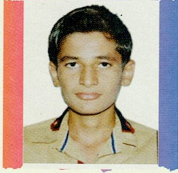
વાવિયા વાસુદેવ લખમણ ધરમશી કંથકોટ ૮૩.૪૩% (૫૮૪/૭૦૦)