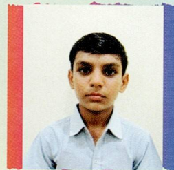
પટણી ગૌતમ બાબુ પમા ચિત્રોડ ૬૪.૦૦% (૪૪૮/૭૦૦)