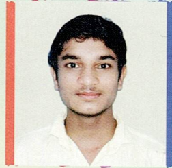
સાંઢા પ્રશાંત ખેતા મનજી વાંઢિયા ૮૦.૫૭% (૫૬૪/૭૦૦)