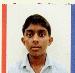
બંગારી સિદ્ધરાજ દેવરાજ કરમશી મેવાસા ૭૯.૮૬% (૫૫૯/૭૦૦)