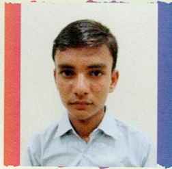
વાવિયા ભરત રામજી ધરમશી કંથકોટ ૬૯.૭૧% (૪૮૮/૭૦૦)