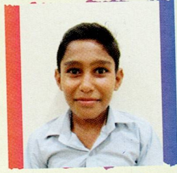
વૈદ હાર્દિક નારણ કેશા હમીરપર ૯૮.૧૧% (૧૭૬૬/૧૮૦૦)