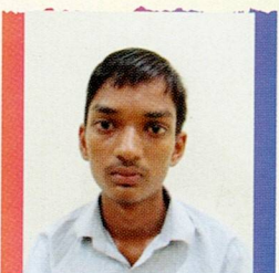
ગાંધી અકેશ માંડણ ભગા દેશલપર ૮૪.૮૬% (૫૯૪/૭૦૦)